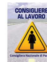
Consigliera Nazionale di Parità